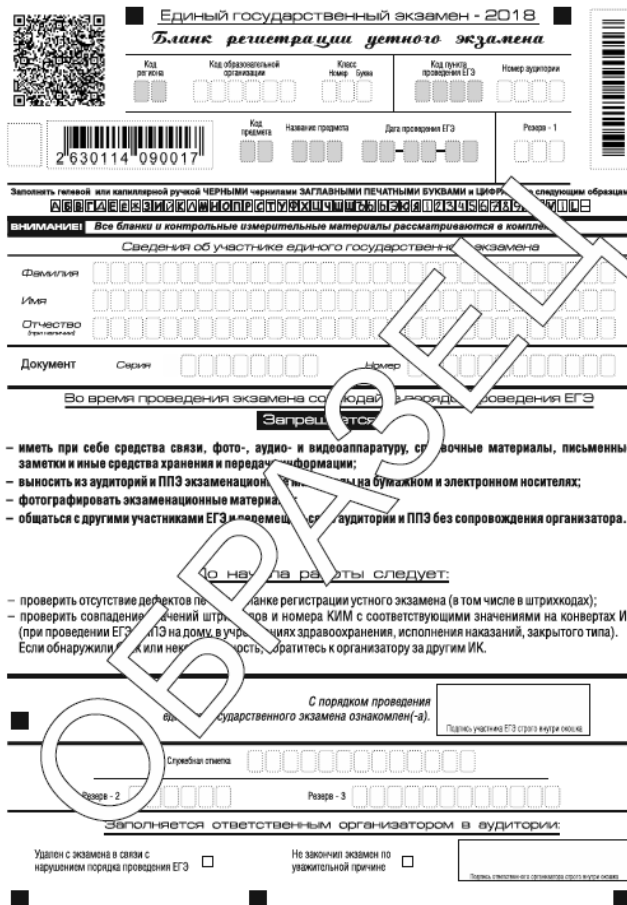
Рис 14. Бланк регистрации устного экзамена